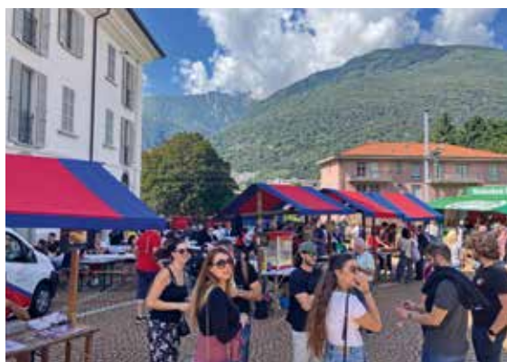
Alcuni scatti dell'edizione del 14 settembre 2025 in Piazza S. Biagio